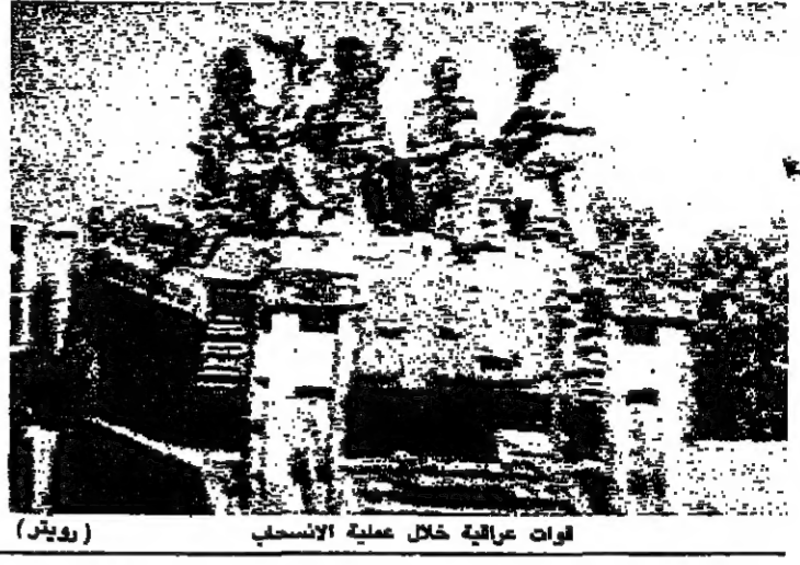
قوات عراقية خلال عملية الانسحاب

قال العراق ان الوحدات الاولى من جيشه المظفر عكبت الكويت اسس وانها قويت بحرارة في العراق. وقال ان قوات اخرى سوف تتسحب غدا.. اما الولايات المتحدة فابتعدت عن تصديقها. وقال رئيس لجنة المخابرات في الكونجرس ان تقرير المخابرات هذا الصباح لم يشر الى ان العراقيين ينسحبون فعلا... وعرض تلفزيون بغداد ما اسمها عملية الانسحاب. من الأراضي والبلدان الكويتية. وقال الناطق الرسمي باسم القيادة العامة للجيش العراقي انه بعد استكمال الوحدات العسكرية وانسحابها اسس ومع استقرار الامن في الكويت تقدر سحب قوات اخرى غدا. ولم يقدم الناطق ارقاماً لعقد القوات التي قل انها انسحبت.